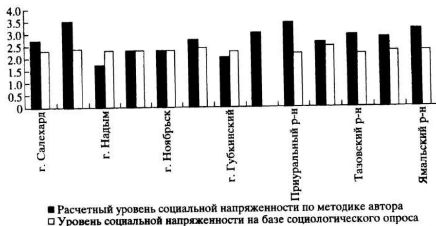
Рис. 2. Демонстрация расхождений результатов, полученных на основании двух методик

Как и при любом исследовании могут быть погрешности и допущения. В результаты, предложенные автором, можно внести некоторые поправки на погрешности в методике социологических опросов, либо на заниженные социальные потребности опрашиваемых жителей этих районов.