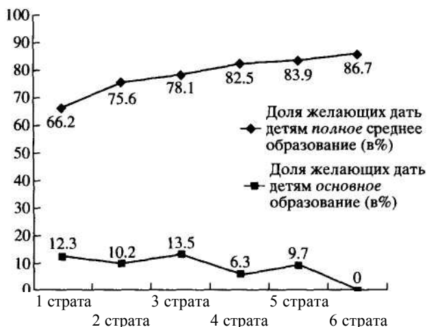
Рис. 1. Доля лиц в различных стратах, желающих дать детям основное и полное среднее образование

Образовательные ориентации тех или иных социальных страт и слоев, на наш взгляд, проявляются в планах получения образования детьми их представителей как в школьные, так и в послешкольные годы. Проанализируем, прежде всего, планы разных групп населения на предмет получения детьми общего образования . В ходе исследования выявлена совершенно определенная зависимость образовательных планов семей от их дохода. Так, стремление дать своим детям полное среднее образование (11 классов) неуклонно растет от 1-й к 6-й страте. Соответственно, намерения ограничить пребывание детей в школе 9-ю классами (основным образованием) обнаруживают тенденцию к понижению (рис. 1).