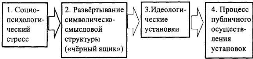
Рис. 1. Процесс зарождения, развёртывания и обозначения идеологических символов.

Теперь мне надо избрать надежный способ расшифровки «черного ящика». Речь пойдет о технологии обнаружения того, как взаимодействуют символические структуры, формируя (или не формируя) региональный синдром в конкретных ситуациях с теми или иными носителями политической воли.