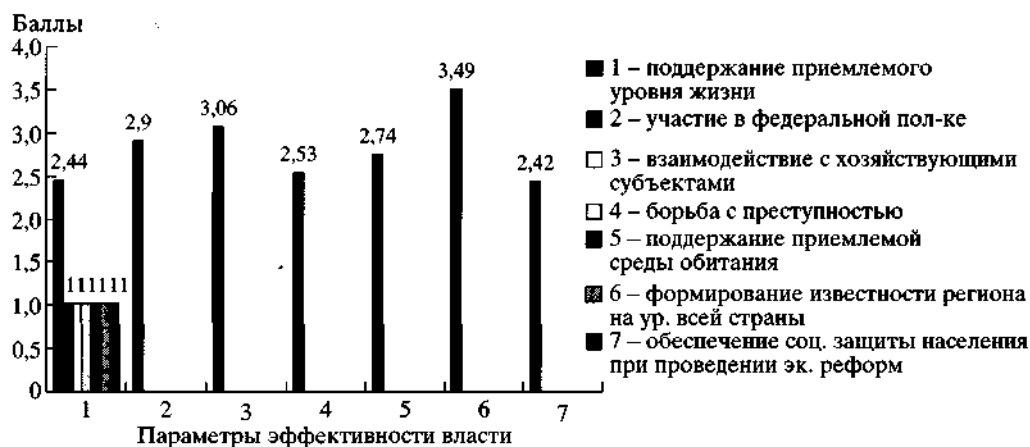
Диаграмма 1. Оценка населением эффективности региональной власти, среднеарифметическое по 5-балльной шкале